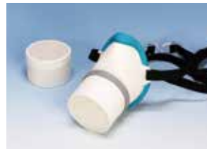
呼気水分低減専用マスク

電池デバイスは地球環境を救うキーデバイスの一つです。その製造を支える技術で、地球環境に貢献していきたいと考えています。