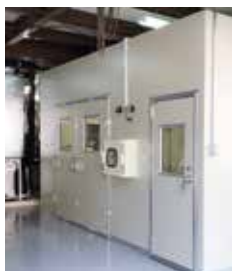
超低露点環境を実現するドライルーム

える製品を開発できることも当社の強みです。お客様の声から生まれた製品のひとつが、露点制御式ドライ・グローブボックス設備です。例えば新製品開発において、ラボ内の超低露点環境で開発に成功した後、次に問題となるのが、量産化に向けて生産工場での製造条件を導き出すことです。当社のドライ・グローブボックスは、マイナス30℃～マイナス70℃の範囲で露点を制御できるのが特長です。ラボ内で露点を制御してさまざまな環境をつくり、製造条件を検討できます。