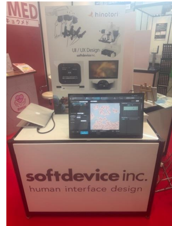
(株)ソフトデバイス