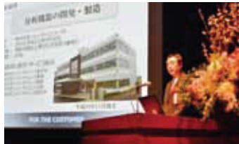
(株)ジェイ・サイエンス・ラボプレゼンテーション