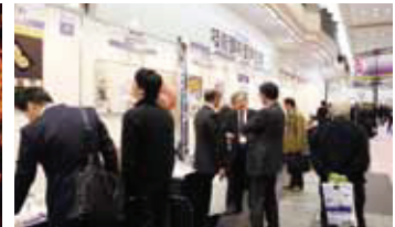
受賞企業展示コーナー