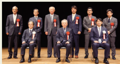
令和4年度 受賞企業代表者