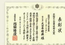
京都府知事による表彰状