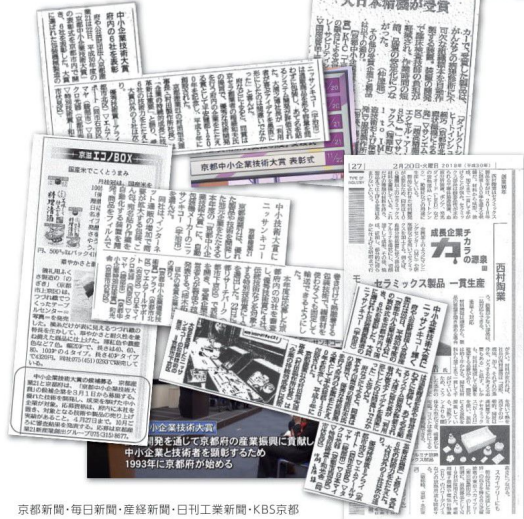
京都新聞・毎日新聞・産経新聞・日刊工業新聞・KBS京都