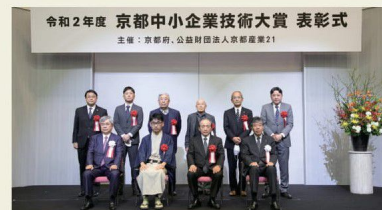
令和2年度受賞企業代表者