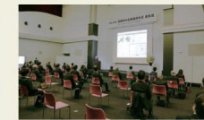
表彰式での受賞企業 プレゼンテーション