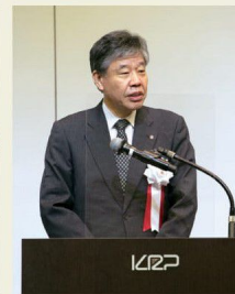
京都府 山下副知事