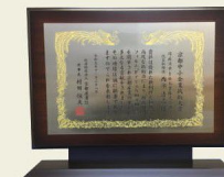
財団理事長による表彰書