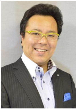
【講師】広報の魔術師