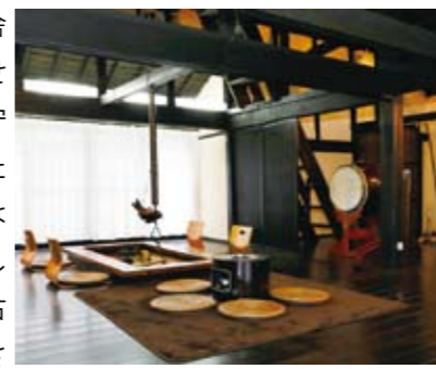
古民家展示場／居間

また、集会場やイベント会場など地域交流の場としても活用していきたいということで、「田舎暮らしの魅力をお届けするパートナーとして、できるだけ多くの関心ある人に見てもらいたいです。そして、そこに住むことになった人が田舎の古民家で個性を大いに発揮して欲しいですね」。