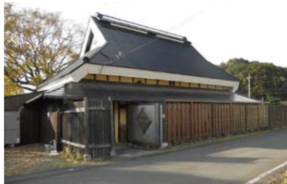
古民家展示場／外観

地方においては、少子高齢化による過疎化が進み、人口の減少に歯止めが掛からない状況です。綾部地域も例外ではなく、人口の減少とともに高齢化率の上昇は大きな社会問題となっています。