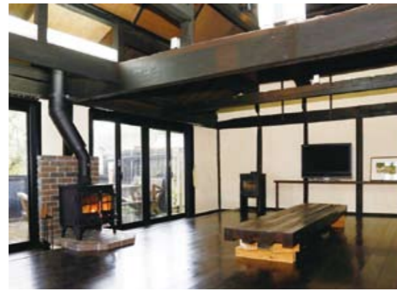
古民家展示場／居間

いなくなった住宅の処分にお困りの方も多く、こうした古民家オーナー様の悩みを解決するお役にも立ちたいと考えています。また、行政がU・I・Jターンを含めた地方への移住を奨励していることもあり、数年前から綾部市と連携して空家への定住者を増やす取り組みを進めることで、地域の活性化を図る活動や他地域の方との交流促進に力を注いでいます。