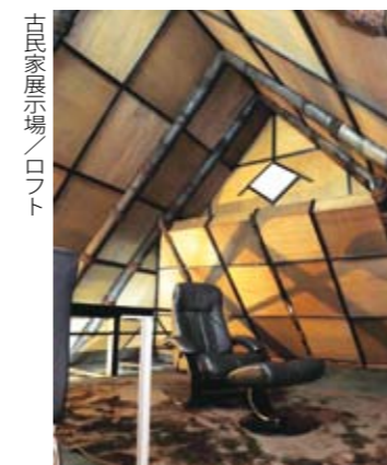
古民家展示場／ロフト

こうした取り組みの中、もっと多くの人に田舎暮らしと改修された古民家の良さをアピールする手だてとして、「古民家展示場」を今年の春にオープンしました。「四季折々の風景が楽しめる農村滞在型の宿泊・体験・研修施設です。一軒貸切りでの使用が可能ですので、ご家族やお友達などと様々な目的でご利用いただけます」。