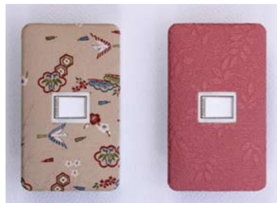
ちりめん生地の風合いが魅せる「スイッチプレート」

電気屋にしかできない、電気屋だからできる新たなニーズを創り出し、丹後ちりめんの需要拡大に貢献できると共に、自社の新たな強み、特徴となり得るものと思案していたところ、ある時「着物の高級生地である丹後ちりめんを使って、スイッチプレートの表面をきれいに覆って見たらどうだろうか」というアイデアが浮かびます。