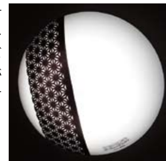
天井の照明器具にもデザインできます

新たな切り口で丹後ちりめんというブランドを再発信し、認知度をもっと向上させることで新たなニーズを創り出す。「自社のこういった取り組みが成功することで、和装以外の用途で丹後ちりめんを活用した製品開発がどんどん進むような環境ができれば嬉しいです」。