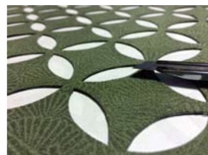
一つひとつ手作業できれいに加工します

この着想を発展させることで、照明器具のシェードに繊細な加工を施した「ちりめんライト」も開発。「どれも手作業で丁寧に作り込むこだわりの商品で、オーダーメイドも可能です。今後は『和ごころ』シリーズとしてさまざまなアイテムを展開していきたいです」。