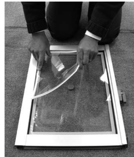
「エコ窓」は素人の方でも簡単に取り付けられます

こうして生まれたのが、従来の窓に簡単に取り付けして断熱と結露防止が一挙にできる「エコ窓」（セルフメイクペアガラス）です。「エコ窓」とは、サッシのガラス面内側にガラスよりも熱伝導性が低いポリカーボネイトの板を取り付けることで、断熱や結露対策に大きな効果を発揮するものです。コストも断熱性の高いガラスに交換するのと比較して約3分の1程度で済みますし、オリジナルの取付治具を使えば素人の方でも容易に取り付けができます。これだけで一般的な複層ガラスとほぼ同程度の断熱性能が得られることから、環境にも家計にも大変優しい商品だといえます。