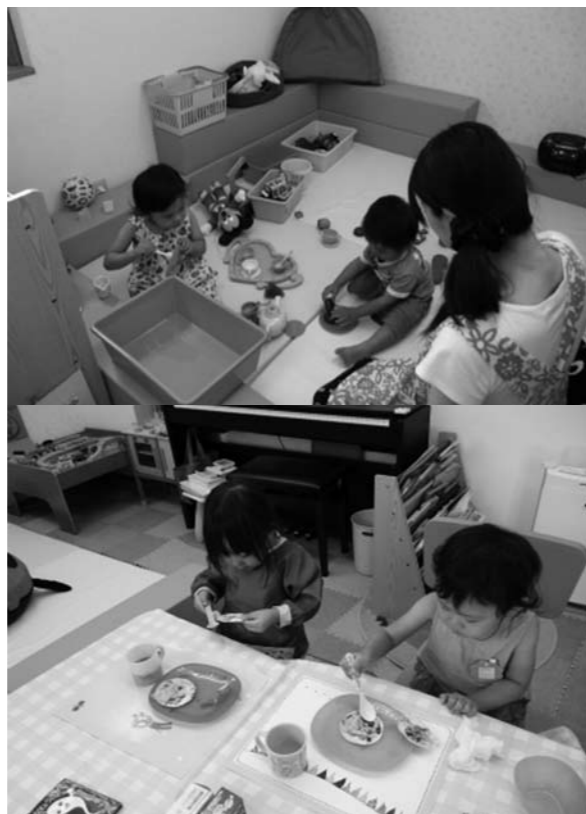
チャイルドルームの様子、少人数制で一人ひとりの子どもと丁寧に向き合います

現在行っている事業は、(1)チャイルドルーム（保育）、(2)幼児教室（プレ幼稚園、英語教室）、(3)Enjoyワンランクアップ講座（ママ等子育て期の方向け講座）です。