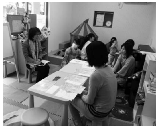
Enjoyワンランクアップ講座の様子、ライブコーディングやコミュニケーション力など、生活に必要な知識と能力を学べます

これらの事業は、通常の保育所や幼稚園ではあまり行われていない内容です。認可外保育施設として多くの方に利用していただくためには、ニーズに柔軟性を持って対応したり、認可保育施設が行っていないサービスを提供したり、ほんの少しの差別化が必要です。かゆい所に優しく温かい手がとどく、そんな思いで行っているそうです。