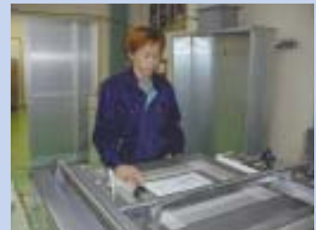
正確で丁寧な印刷は定評がある