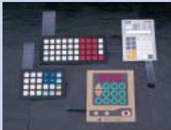
メンブレン・キーボードスイッチ製品群

企業名：株式会社東洋レーベル 代表者：吉川 弘 資本金：1 000万円 従業員：34名 設立：昭和52年10月 所在地：京都市右京区西京極畑田町8 URL：http://www.toyolabel.co.jp TEL：075-314-2117 FAX：075-313-4652 E-mail：info@toyolabel.co.jp 事業内容：各種シール・ラベルの企画～印刷～加工TLAニバン・盛り上げ転写シール、精密スクリーン印刷、メンブレン・キーシート、板金・塗装、シルク印刷