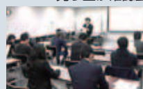
第3回 売り上げ確認会

経営者育成大学で学んだカリキュラムに対して、卒業後も頻度を上げて定着させる事を目指し、練成会として立ち上げ、年3回集まる機会を設けて鍛えあげる。最低5年間は継続し、5年後の自社の業績を上げることを目的として活動しています。