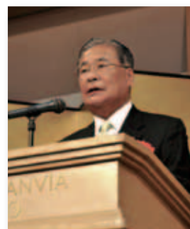
立石京都商工会議所会頭