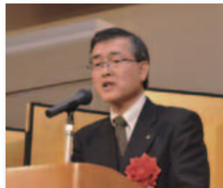
太田京都府副知事