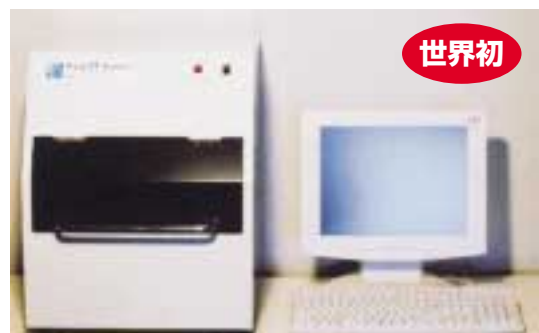
自社開発製品：X線密度・厚さ面分布測定装置 X-ray DT Scanner DDM+2101