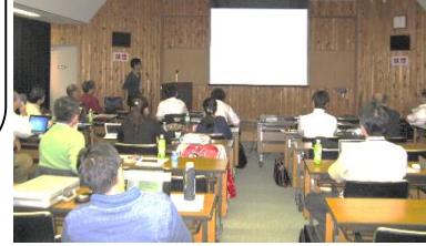
昨年度の 研修風景 上:グループ討議 左:発表会