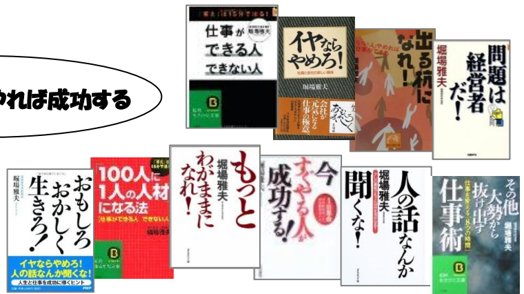
株式会社 堀場製作所 最高顧問 堀場 雅夫氏

現在、日本新事業支援機関協議会の会長、財団法人 京都高度技術研究所の最高顧問など数多くの要職を歴任され、精力的に起業家育成支援に尽力されています。また、著書に『イヤならやめろ!』、『出る杭になれ!』、『仕事ができる人できない人』など、ベストセラーも数多くあり、多くのビジネスマンにシンプルで本質を突くメッセージが共感を与えている。